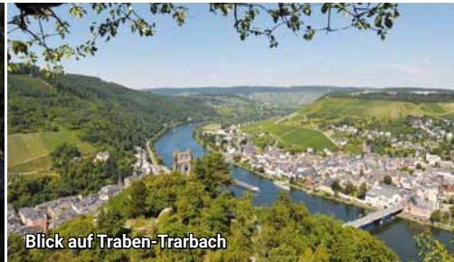
Blick auf Traben-Trarbach